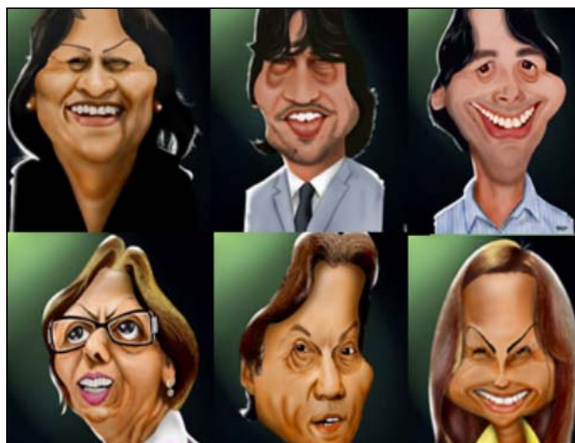
Exposição é composta por 46 caricaturas de políticos potiguares

O tema da exposição, segundo o cartunista, foi escolhido a partir de sua ligação com trabalhos artísticos relaciona-